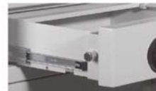
Schublade gepanzert auf Teleskopschienen laufend