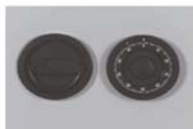
Art. Nr.: 36220