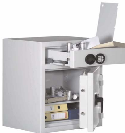
Abb. Art.-Nr. 36200 Haupttür und Schublade mit Elo-Schloss gg. Mehrpreis

Sprechen Sie mit Ihrer Versicherung. Einbruchschutz baugleich VdS 2450 EN 1143-1 Klasse I, Schutz gegen leichte Brände. Korpus allseitig mehrwandig mit 105 mm starker Tür. Die gepanzerte Schublade ist 200 mm hoch, mehrwandig wie Haupttür. Teleskopschienen erleichtern das Öffnen und Schließen. Das neu konzipierte Einwurfsystem verhindert das Rückholen eingeworfener Werte (z.B. Geldtasche etc.). Tresortür und Schublade werden jeweils mit einem Doppelbartsicherheitsschloss (incl. zwei Schlüsseln) gesichert. Tresortür und Schublade auf Wunsch auch mit mechanischem Zahlenkombinationsschloss oder Elektronikschloss lieferbar (gegen Mehrpreis). Die Schublade kann auch rückseitig, seitwärts oder überstehend gefertigt werden (gegen Mehrpreis). Sonderanfertigungen auf Kundenwunsch gegen Mehrpreis möglich.