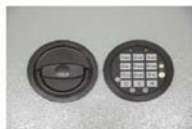
Art. Nr.: 36221+Art. Nr.: 36222