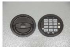
Art. Nr.: 36021+ Art. Nr.: 36022