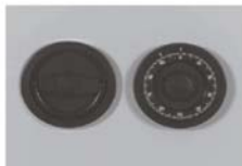
Art. Nr.: 36020