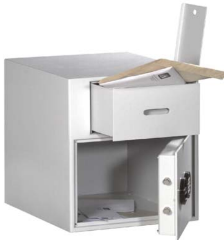
Art.-Nr. 35915 mit 39521