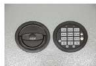
Art.-Nr. 35921 + 35922

Einwurfmechanismus siehe Skizze auf Rückseite