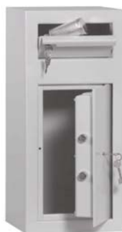
Abb. Art.-Nr. 35700

Sprechen Sie mit Ihrer Versicherung Korpus 1-wandig 3 mm, mit doppelwandiger Tür (Türblatt 6 mm). Gesamttürstärke 45 mm. Mit Einwurfklappe 3 mm stark mit Zyl.-Schloss in Frontseite oben. Beim Schließen der Klappe fällt das eingelegte Material (z.B. Geldtasche etc.) in den Tresor. Eine Rückholsicherung verhindert die Entnahme des eingeworfenen Materials über die Einwurfklappe. Tür mit Doppelbartsicherheitsschloss (incl. zwei Schlüsseln). Auf Wunsch auch mit mechanischem Zahlenkombinationsschloss oder Elektronikschlössern lieferbar (gegen Mehrpreis). Rückwand und Boden mit je 2 Bohrungen für Verankerung durchgebohrt. Sonderanfertigungen auf Kundenwunsch, wie Einwurfklappe an Rückseite oder Seitenwände gegen Mehrpreis möglich.