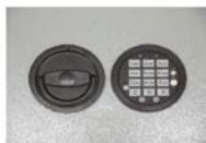
Art.-Nr. 35721 + 35722