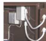
Art.-Nr. 36424 EMA-Komponenten für Tresor gg. Mehrpreis

Sonder- Maße u. Ausführungen gg. Mehrpreis lieferbar - Berechnungsgrundlage s. Seite 1 der Preislisten ! Leistungsmerkmale mech. Zahlen- und Elektronischschlösser s. Sonderseiten Schlösser und Beschläge !