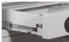
gepanzerte Schublade auf Teleskopschienen