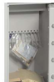
Verschiebblech deckt Schacht ab und Wertsache fällt in Safe