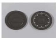
Art. Nr.: 36120