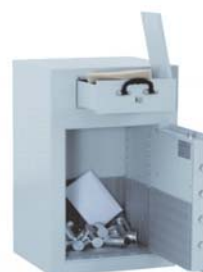
Art. Nr.: 36100

Sonder- Maße u. Ausführungen gg. Mehrpreis lieferbar - Berechnungsgrundlage s. Seite 1 der Preislisten ! Leistungsmerkmale mech. Zahlen- und Elektronikschlösser s. Sonderseiten Schlösser und Beschläge !