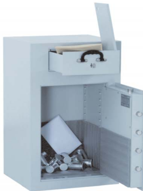
Abb. Art.-Nr. 36100 mit DB-Standardschloss

Sonderanfertigungen auf Kundenwunsch gegen Mehrpreis möglich.