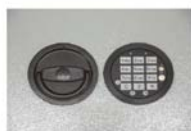
Art. Nr.: 36121+Art. Nr.: 36122