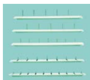
Details s. Katalogseite 2a