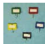
Art.-Nr. 10023 Schlüsselanhänger gg. Mehrpreis

Sonder- Maße u. Ausführungen gg. Mehrpreis lieferbar - Berechnungsgrundlage s. Seite 1 der Preislisten ! Leistungsmerkmale mech. Zahlen- und Elektronikschlösser s. Sonderseiten Schlösser und Beschläge !