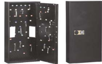
13101 + 13126 mit kl. Innensafes mit Zahlenschloss verstellbar