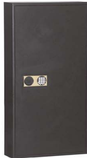
mit Art. 13121 gg. Mehrpreis

Weitere Inneneinrichtungsvarianten gg. Mehrpreis möglich!