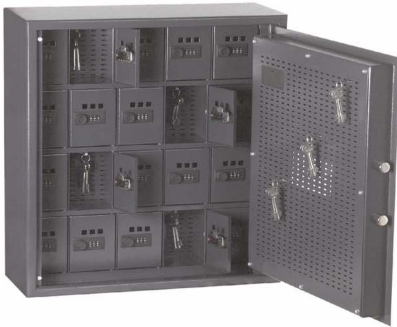
Art.-Nr. 13101 mit 13126 mit kleinen Innensafes (Mindestmaße: 115x92x95 mm HxBxT) mit verstellbaren Zahlenschlossern, gg. Mehrpreis