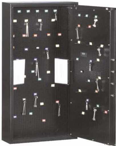
Art.-Nr. 13104 mit individuell höhen- und breitenverstellbarem Hakensystem gg. Mehrpreis