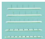
Details siehe Katalogseite 2 a