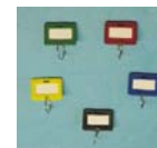
Art.-Nr. 05026 Schlüsselanhänger