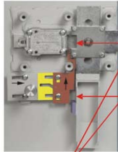
Schloss und Riegelwerk offen