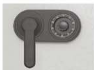
Art. Nr.: 32020