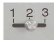
Art.32025 (Funktions-Skizze s. Rückseite) Stellung 1 Schloss und Riegelwerk frei Stellung 2 sperrt Schloss Stellung 3 sperrt Schloss und Riegelwerk

Sonder- Maße u. Ausführungen gg. Mehrpreis lieferbar - Berechnungsgrundlage s. Seite 1 der Preislisten ! Leistungsmerkmale mech. Zahlen- und Elektronikschlösser s. Sonderseiten Schlösser und Beschläge !