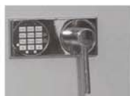
Art.-Nr. 32023+32025 (verchromter Beschlag gg. Mehrpreis)