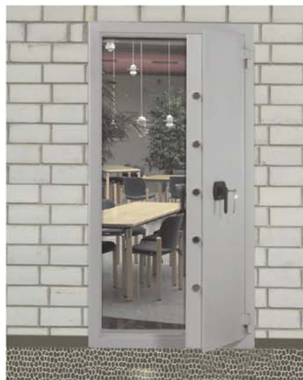
Abb.: Art-Mr. 32002 mit DB-Standardschloss