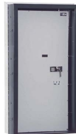
Art-Nr. 55301 mit Art. 55323 ( 2. Tastatur von innen f. Elo GST) und 55325 zusätzliche Blockiersperre Außentürseite mit 55326 gg. Aufpreis