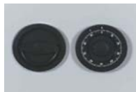
Art. Nr.: 22020