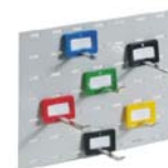
Art. 22023 - 22025 Hakensortiment gg. Aufpreis

Sonder- Maße u. Ausführungen gg. Mehrpreis lieferbar - Berechnungsgrundlage s. Seite 1 der Preislisten ! Leistungsmerkmale mech. Zahlen- und Elektronikschlösser s. Sonderseiten Schlösser und Beschläge !