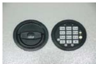
Art. Nr.: 22021+22022