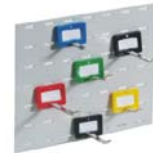
Art. 22023 - 22025 Hakensortiment gg. Aufpreis

Sonder- Maße u. Ausführungen gg. Mehrpreis lieferbar - Berechnungsgrundlage s. Seite 1 der Preislisten ! Leistungsmerkmale mech. Zahlen- und Elektronikschlösser s. Sonderseiten Schlösser und Beschläge !