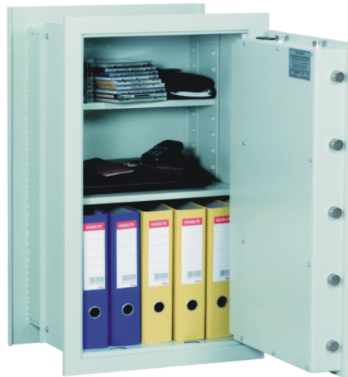
Abb. Art.-Nr. 23004 mit DB-Standardschloss