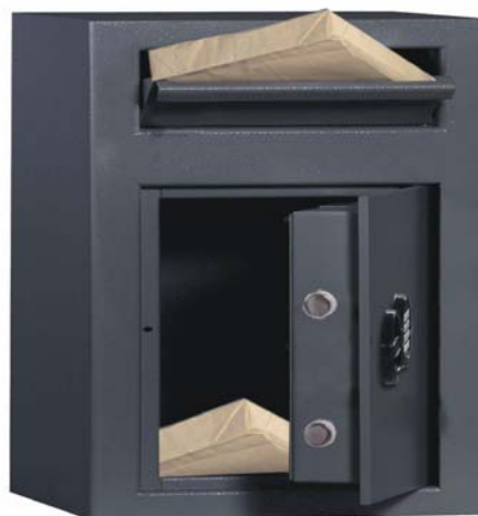
Art. n° 35810 avec 35821

Fabrications spéciales à la demande du client possibles contre plus-value.