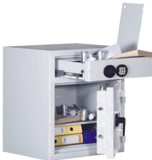
III. art. n° 36200 porte principale et tiroir avec serrure Elo contre plus-value

Fabrications spéciales à la demande du client possibles contre plus-value.