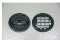
Art. n°: 36221+art. n° 36222