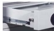
Le tiroir blindé glisse sur des rails télescopiques