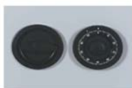
Art. n° 36220