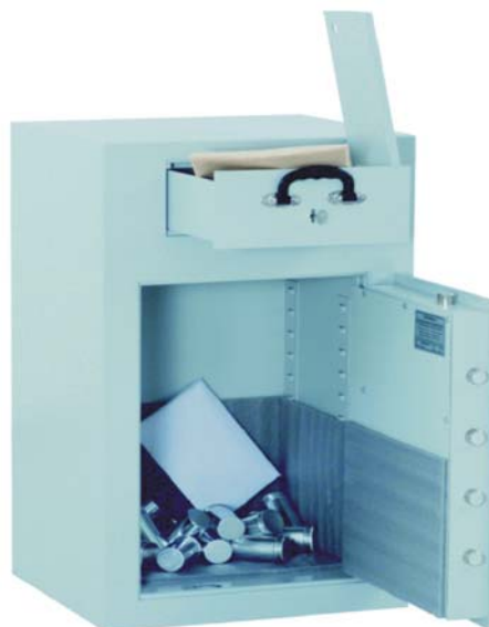
Sur toutes les ill.: art. n° 36001 avec serrure DB standard