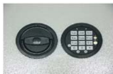
Art. n°: 36021+ Art. n°: 36022