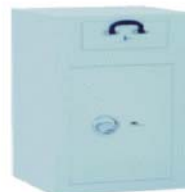
Art. n° 36000

Dimensions et fabrications spéciales livrables contre plus-value base des calculs voir page 1 des tarifs!