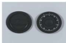
Art. n° 36020