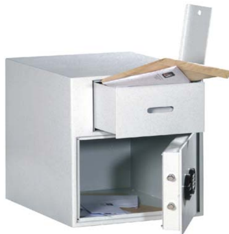
Art. n° 35915 avec 39521