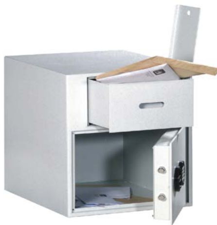
Art. n° 35910 avec 35921

Fabrications spéciales à la demande du client, comme tiroir sur le côté arrière ou sur le côté et dépassant, sont possibles contre un supplément.