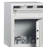
Art. n° 35703

Dimensions et fabrications spéciales livrables contre plus-value base des calculs voir page 1 des tarifs!