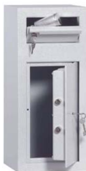
Art. n° 35700

Une protection contre le repêchage empêche de reprendre le matériel déposé dans la trappe de dépose. Porte avec serrure de sécurité à double panneton (y compris deux clefs). Sur demande, livrable aussi avec une serrure mécanique de combinaison ou une des serrures électroniques (contre plus-value). La paroi arrière et le fond sont percés chacun de 2 percements pour l'ancrage. Fabrications spéciales à la demande du client, comme trappe de dépose à l'arrière ou sur le côté, possibles contre plus-value.