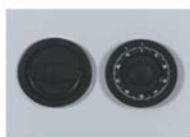
Art. n° 35720