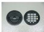
Art. n° 35721 + 35722