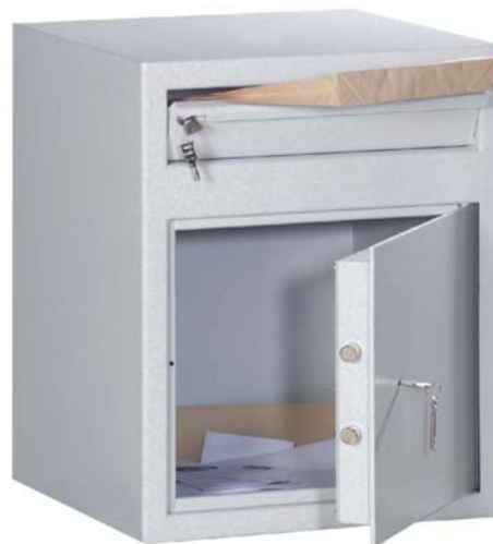
Art. n° 35703

Mécanisme de dépose voir esquisse au dos