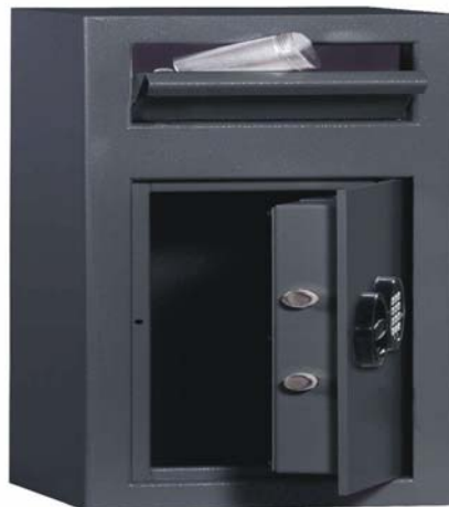
Art. n° 35800 avec 35821