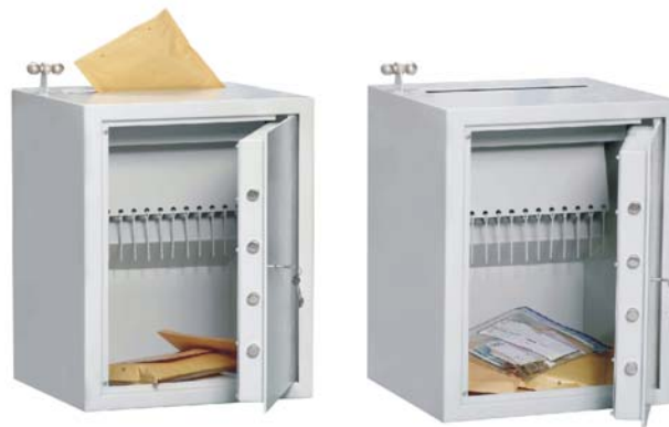
Art. n° 35901

Corps à paroi simple 3 mm, porte à paroi double (feuille de la porte 6 mm). Épaisseur totale de la porte 45 mm. Avec fente de dépose dans la plaque du haut dans la partie arrière largeur 330 mm et profondeur 40 mm. Une goulotte mobile pour la dépose, à actionner à l'aide d'un levier qui se trouve sur le côté près de la fente de dépose, garantie la dépose sûre des divers objets de valeur. Porte principale avec serrure de sécurité à double panneton (y compris deux clefs). Sur demande, livrable aussi avec une serrure mécanique de combinaison ou une serrure électronique (contre plus-value). La paroi arrière et le fond sont munis chacun de 2 percements pour l'ancrage. Fabrications spéciales à la demande du client possibles contre plus-value, p. ex. fente sur le devant de la plaque du haut.