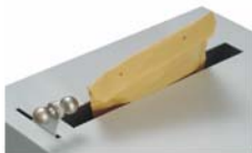
Tirer le levier La goulotte est accessible

En tirant le levier vers l'avant, la goulotte de dépose s'ouvre. Après la dépose de l'objet, relâcher le levier et la tôle d'obturation ferme automatiquement l'ouverture de la goulotte et l'objet tombe à l'intérieur de coffre-fort.