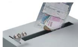
Ouverture de la goulotte avec levier

Mécanisme de dépose voir esquisse au dos