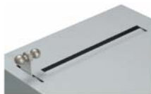
Après la dépose de l'objet de valeur, relâcher le levier