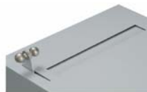
Levier dans la position de base La tôle d'obturation recouvre la goulotte et l'objet de valeur tombe dans le coffre-fort.