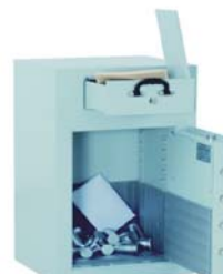
Art. n° 36100

Dimensions et fabrications spéciales livrables contre plus-value base des calculs voir page 1 des tarifs! Caractéristiques des serrures méc. à chiffres ou électroniques, voir pages spéciales Serrures et ferrures!