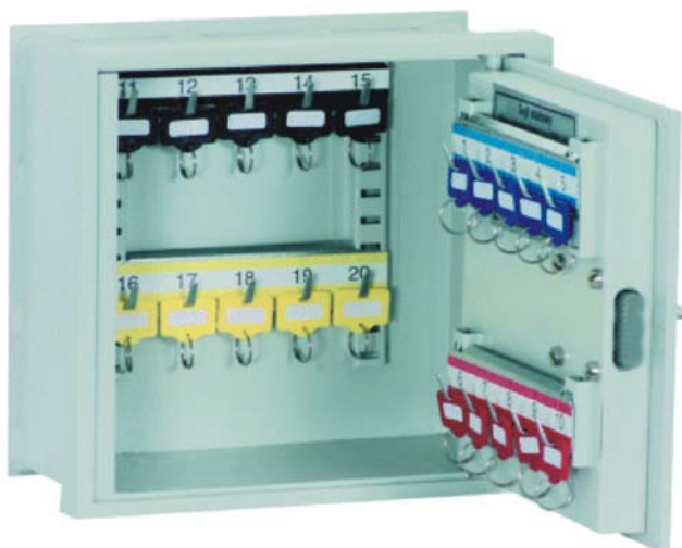
III. art. n° 10000 avec serrure DB standard (Livraison sans porte-clefs)

Barres à crochets à écartement large et crochets spécialement longs livrables sur demande.