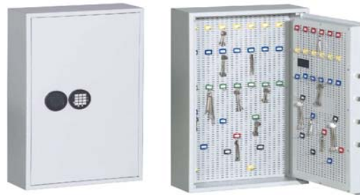
III.Art. n° 13201

niveau de sécurité S 1 d'après VdS 2862 pr EN 14450-2002. Corps à paroi simple 3 mm. Porte à paroi double épaisseur 65 mm avec feuillure coupe-feu faisant le tour avec système de pènes bloquant sur 3 côtés et feuille de porte de 6 mm. De série avec deux percements dans le fond et la paroi arrière pour l'ancrage, y compris matériel d'ancrage. Le verrouillage se fait par une serrure de sécurité à double panneton (y compris deux clefs). Attention: Les armoires sont lourds par le devant et doivent absolument être ancrées selon le mode d'emploi joint! Paroi arrière et porte ainsi que côtés avec nouveau system de crochets par lequel il est possible de régler la hauteur et la largeur en continu. Il est ainsi possible de faire un ajustage précis pour les clefs et les trousseaux ! Les crochets sont livrables en 3 longueurs, lors de la commande, il faut les commander comme accessoire contre supplément ! Laquage: RAL 7035 gris