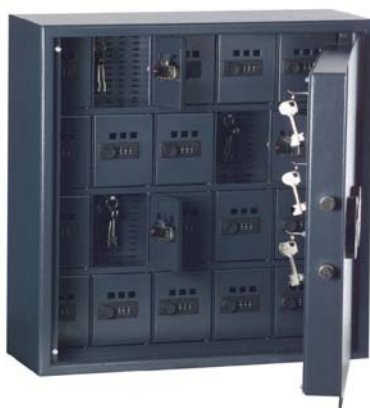
13201 + 13226 avec petit coffre-fort intérieur avec serrure de combinaison réglable pour ranger des clefs spécialement importantes, avec vitre de contrôle