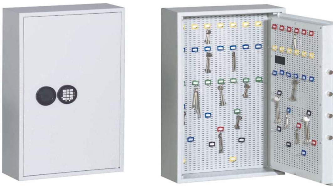
III. Art. n° 13201

Modèles «Düren» niveau de sécurité S 1 d'après VdS 2862 pr EN 14450-2002