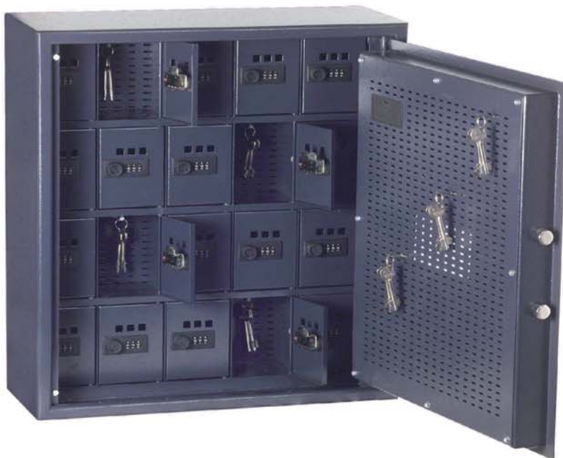
Art. n° 13101 mit 13126 avec petit coffre-fort intérieur ( dimensions min.: 115x92x95 mm HxLxP ) avec serrures à combinaison, contre plus-value

Coffres-forts pour clefs Modèles «Leipzig» niveau de sécurité A d'après VDMA 24992 édition mai 95