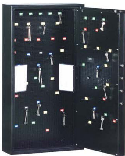
avec système de crochets réglable en hauteur et en largeur contre plus-value