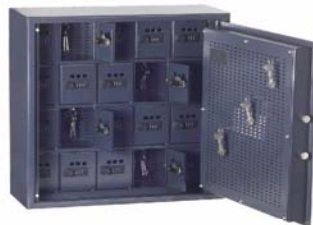
13101 + 13126 avec petit coffre-fort in. avec serrure de comb.