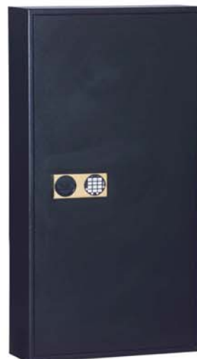
avec art. 13121 contre plus-value

D'autres variantes d'équipement intérieur possible contre plus-value!