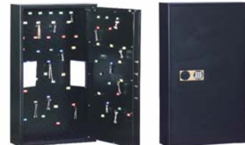
III.Art. n° 13104

pour le rangement à part des clefs importantes avec vitre de contrôle (d'autres variantes d'aménagement possibles contre plus-value)