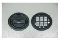
Art. n° 23021+23022