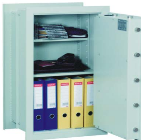
III. art. n° 23004 avec serrure DB standard