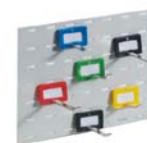
Art. n° 22023 - 22025 Assortiment de crochets contre plus-value

Dimensions et fabrications spéciales livrables contre plus-value base des calculs voir page 1 des tarifs! Caractéristiques des serrures méc. à chiffres ou électroniques, voir pages spéciales Serrures et ferrures!