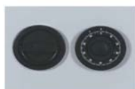
Art. n° 23020