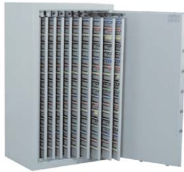
Abb.Art.-Nr. 15010 (Lieferung erfolgt ohne Schlüsselanhänger)