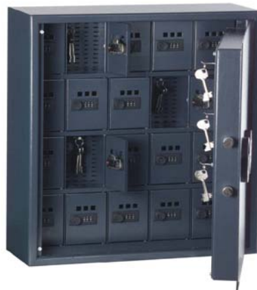
13201 + 13226 mit kleinen Innensafes mit Zahlenschloss verstellbar zur Aufbewahrung spezieller wichtiger Schlüssel mit Kontroll-Sichtfenstern