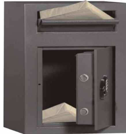
Art.-Nr. 35810 mit 35821

Sprechen Sie mit Ihrer Versicherung Korpus und Tür doppelwandig 60 mm stark. Gesamttürstärke mit 6 mm Türblatt 60 mm. Mit Einwurfklappe in Frontseite oben. Einwurfklappe mit DB-Schloss inkl. 2 Schlüssel. Einwurfklappe auch mit DB-Schloß verschieden schließend über HS - Anlage oder gleichschließend möglich (bitte bei Bestellung angeben !) . Beim Schließen der Klappe fällt das eingelegte Material (z.B. Geldtasche etc.) in den Tresor. Das neu konzipierte Einwurfsystem verhindert die Entnahme des eingeworfenen Materials über die Einwurfklappe. Haupttür mit Doppelbartsicherheitsschloss (incl. zwei Schlüsseln). Auf Wunsch auch mit mechanischem Zahlenkombinationsschloss oder Elektronikschlössern lieferbar (gegen Mehrpreis). Rückwand und Boden mit je 2 Bohrungen für Verankerung vorgebohrt. Sonderanfertigungen auf Kundenwunsch gegen Mehrpreis möglich. Lackierung: RAL 7035 grau