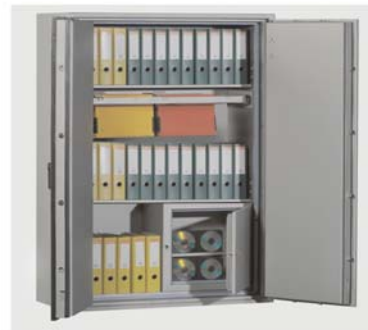
Abb. Art.-Nr. 43114 mit Disketteneinsatz + 43127 Hängeregistratur gg. Aufpreis

Durch Ausführung nach VDMA 24992 Sicherheitsstufe B Ausg. Mai 95. Feuerschutz durch Brandprüfung nach EN 1047-1 Güteklasse S 60 P. Zertifiziert und güteüberwacht durch VdS-Zert. in Köln. Korpus und Tür mehrwandig. Tür 95 mm stark, mit allseitiger Bolzenverriegelung. Durch spezielle Füllungen und Dichtungen sind darin aufbewahrte Dokumente, Akten, Geld etc. optimal vor Bränden und Löschwasser geschützt. Die Schränke wurden an der TU Braunschweig erfolgreich einer Feuerwiderstands- und Sturzprüfung, dauer 1 Stunde, bis 1090°C, unterzogen. Verriegelung über Doppelbartschloss. (incl. zwei Schlüsseln) Beschläge u. Scharniere 60 mm vorstehend. Lackierung: RAL 7035 grau