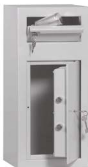
Abb. Art.-Nr. 35700

Sprechen Sie mit Ihrer Versicherung Korpus 1-wandig 3 mm, mit doppelwandiger Tür (Türblatt 6 mm). Gesamttürstärke 45 mm. Mit Einwurfklappe 3 mm stark mit Zyl.-Schloss in Frontseite oben. Beim Schließen der Klappe fällt das eingelegte Material (z.B. Geldtasche etc.) in den Tresor. Eine Rückholsicherung verhindert die Entnahme des eingeworfenen Materials über die Einwurfklappe. Tür mit Doppelbartsicherheitsschloss (incl. zwei Schlüsseln). Auf Wunsch auch mit mechanischem Zahlenkombinationsschloss oder Elektronikschlössern lieferbar (gegen Mehrpreis). Rückwand und Boden mit je 2 Bohrungen für Verankerung durchgebohrt. Sonderanfertigungen auf Kundenwunsch, wie Einwurfklappe an Rückseite oder Seitenwände gegen Mehrpreis möglich.