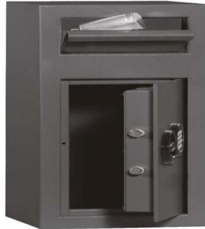
Art.-Nr. 35800 mit 35821

Sprechen Sie mit Ihrer Versicherung Korpus 1-wandig, Tür doppelwandig (Türblatt 6 mm). Gesamttürstärke 45 mm. Mit Einwurfklappe in Frontseite oben. Einwurfklappe mit Zylinderschloss verschieden schließend über HS - Anlage oder gleichschließend möglich (bei Bestellung angeben !). Beim Schließen der Klappe fällt das eingelegte Material (z.B. Geldtasche etc.) in den Tresor. Das neu konzipierte Einwurfsystem verhindert die Entnahme des eingeworfenen Materials über die Einwurfklappe. Haupttür mit Doppelbartsicherheitsschloss (incl. zwei Schlüsseln). Auf Wunsch auch mit mechanischem Zahlenkombinationsschloss oder Elektronikschlössern lieferbar (gegen Mehrpreis). Rückwand und Boden mit je 2 Bohrungen für Verankerung durchgebohrt. Sonderanfertigungen auf Kundenwunsch gegen Mehrpreis möglich.