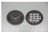
Art.-Nr. 35921 + 35922