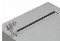
nach Einwurf Wertsache Hebel loslassen