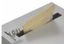
Hebel heranziehen Schachtfreigabe

Funktionsweise : Durch Betätigen des Hebels nach vorn wird der Einwurfschacht geöffnet . Nach Einwurf des Gutes wird der Hebel freigegeben und das Verschiebblech schließt automatisch die Schachtöffnung und das Gut fällt in den Innenbereich des Safes .