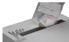
Schachtöffnung mit Bedienhebel

Einwurfmechanismus siehe Skizze auf Rückseite