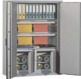
Abb. Art.-Nr. 44764 mit 2x Art. 44630 Disketteneinsatz und 2x Art. 44727 Hängeregistratur auf Teleskopschienen gg. Aufpreis

Einbruchschutz 50 / 80 RU Feuerschutz durch Brandprüfung nach EN 1047-1 Güteklasse S 60 P. Zertifiziert und güteüberwacht durch VdS-Zert in Köln. Korpus und Tür mehrwandig. Tür 100 mm stark, mi allseitiger Bolzenverriegelung. Durch spezielle Füllungen und Dichtungen sind darin aufbewahrte Dokumente, Akten, Geld etc. optimal vor Bränden und Löschwasser geschützt. Die Schränke wurden an der TU Braunschweig erfolgreich einer Feuerwiderstands- und Sturzprüfung, Dauer 1 Stunde, bis 1090°C, unterzogen. Der Test wurde erfolgreich abgeschlossen. Verriegelung über Doppelbartsicherheitsschloss (incl. zwei Schlüsseln). Beschläge - Scharniere 60 mm vorstehend. Serienmäßig zur Bodenverankerung vorgesehen. Lackierung: RAL 7035 grau