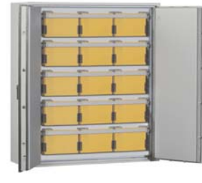
Abb. Art.-Nr. 44627 mit 5x Art. 44627 Hängeregistratur auf Teleskopschienen gg. Aufpreis

Sonder- Maße u. Ausführungen gg. Mehrpreis lieferbar - Berechnungsgrundlage s. Seite 1 der Preislisten ! Leistungsmerkmale mech. Zahlen- und Elektronikschlösser s. Sonderseiten Schlösser und Beschläge !