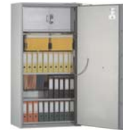
Abb. Art.-Nr. 44604 mit Art. 44633 Innentresor 420 mm H mit Elektronik- schloss ePass (Sondereinrichtung möglich siehe Sonderseite 47/III Einrichtungsvarianten Vor- und Rückseite) und Art. 44627 + Art. 44626 + Art. 44634 gg. Aufpreis

Sonder- Maße u. Ausführungen gg. Mehrpreis lieferbar - Berechnungsgrundlage s. Seite 1 der Preislisten ! Leistungsmerkmale mech. Zahlen- und Elektronikschlösser s. Sonderseiten Schlösser und Beschläge !