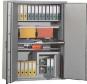
Abb. Art.-Nr. 44614 mit Art. 44630 Disketteneinsatz + Art. 44625 Fachboden auf Teleskopschienen + Art. 44627 Hängeregistratur auf Teleskopschienen gg. Aufpreis

Beschläge u. Scharniere 60 mm vorstehend. Lackierung: RAL 7035 grau